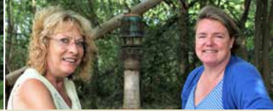
Ontmoet elkaar op een Babbelbank (p. 3)