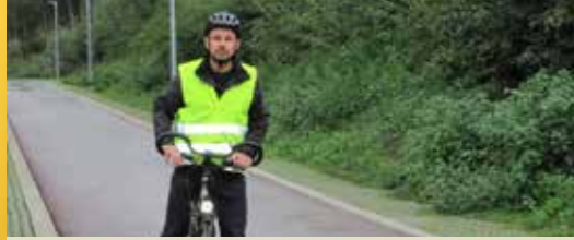
N-VA werkt aan een vlot en veilig Zemst (p. 2)